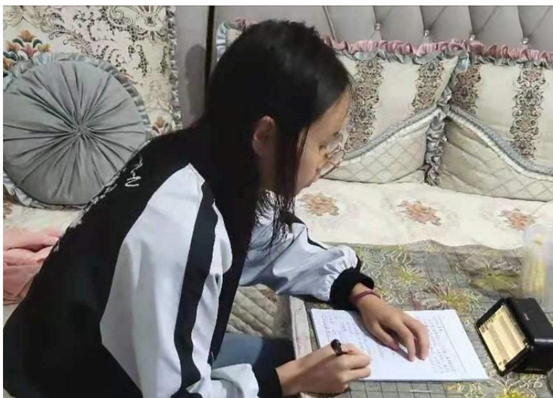
幼儿班教师在参加线上培训时边看边记笔记