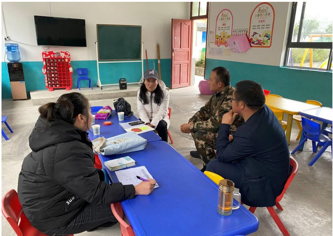
项目人员与幼儿班教师、学校领导交流了解幼儿班的情况