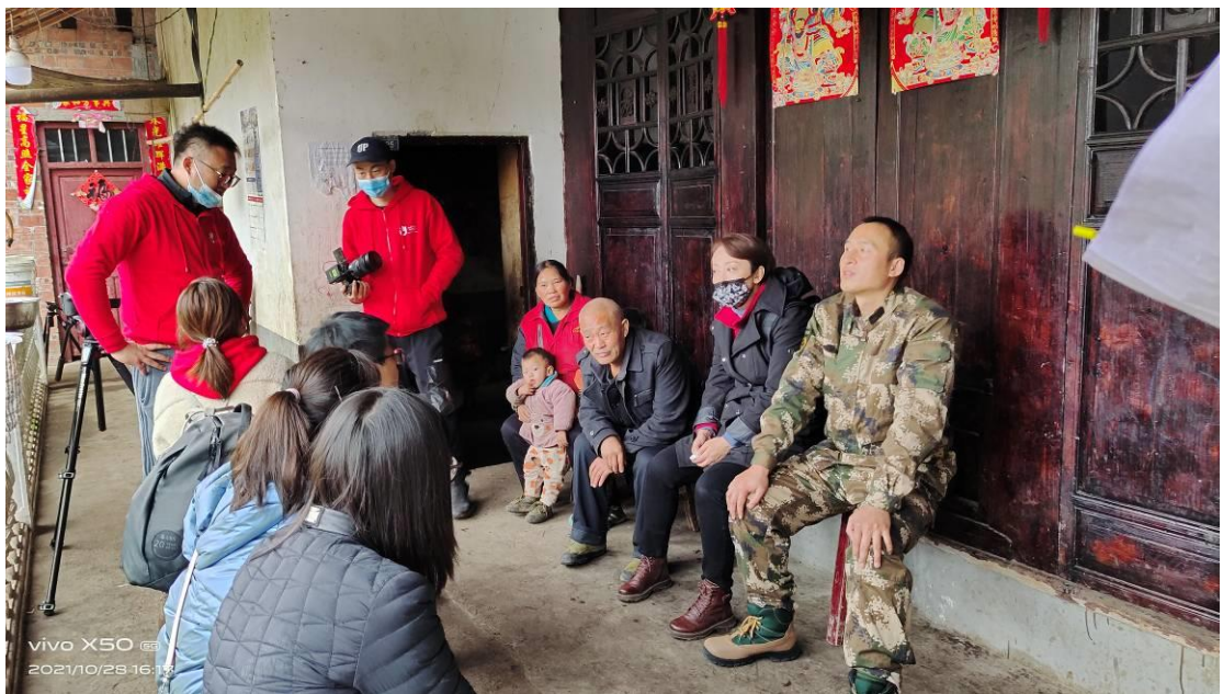
拜访人员到幼儿班孩子家中入户拜访