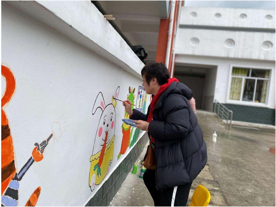
拜访人员为幼儿园绘画墙画