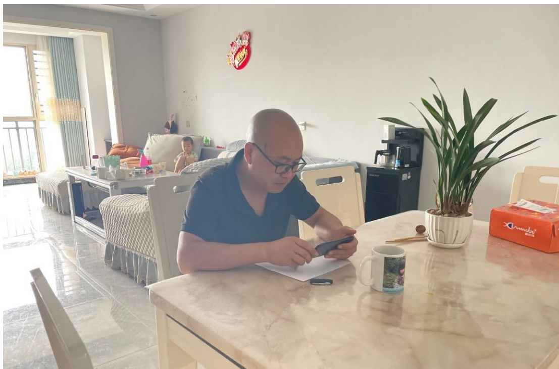
幼儿班教师在家里参加线上岗前培训