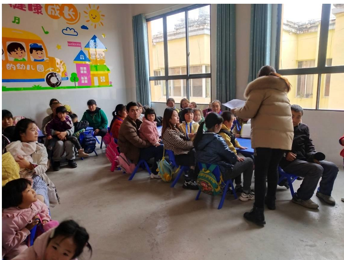
花朗中心园大二班开展家长培训