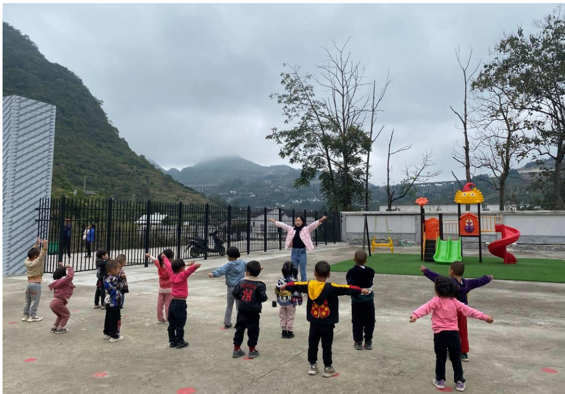
罗甸幼儿班开展户外活动