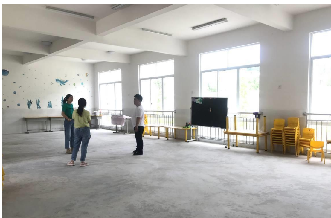
项目人员在罗甸幼儿园了解情况