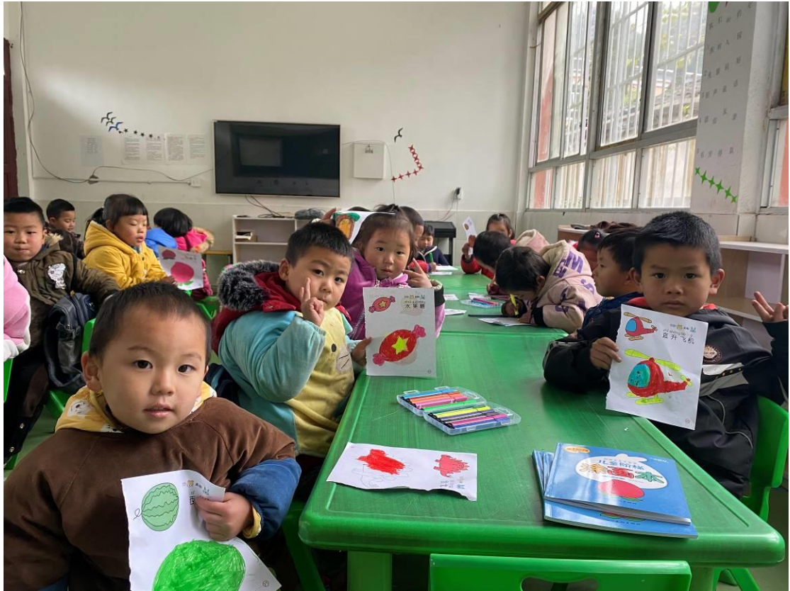
幼儿班小朋友使用项目配置的水彩笔画画