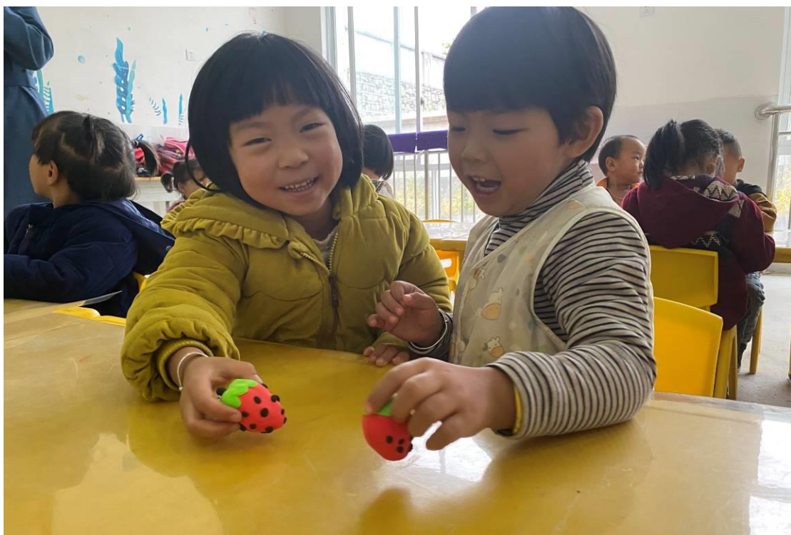
幼儿班孩子用项目提供的粘土开展手工课——制作草莓