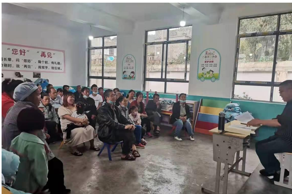
林正中班在开展家长培训