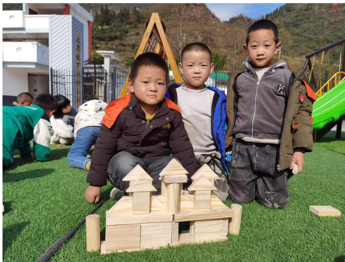
罗甸幼儿班孩子使用项目配置的实木积木玩游戏

玩教具的配置对提高项目幼儿班的办学条件和教学活动开展质量起到了很好的作用。幼儿班教师也反馈说以前上课基本上就是老师讲，小朋友听，教师讲一天，小朋友也坐不住，现在有了这些玩教具，课堂教学活动丰富了，小朋友的学习兴趣也提高了。项目人员在督导时也看到，幼儿班小朋友对项目配备的玩教具爱不释手，开心地搭积木、玩雪花片，孩子的动手能力得到了很好的锻炼。