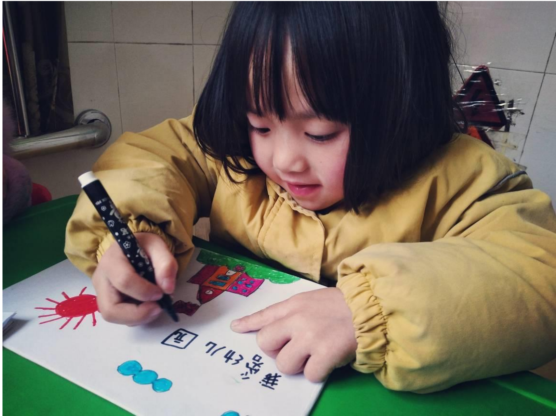
项目人员查看幼儿班的教学活动开展情况