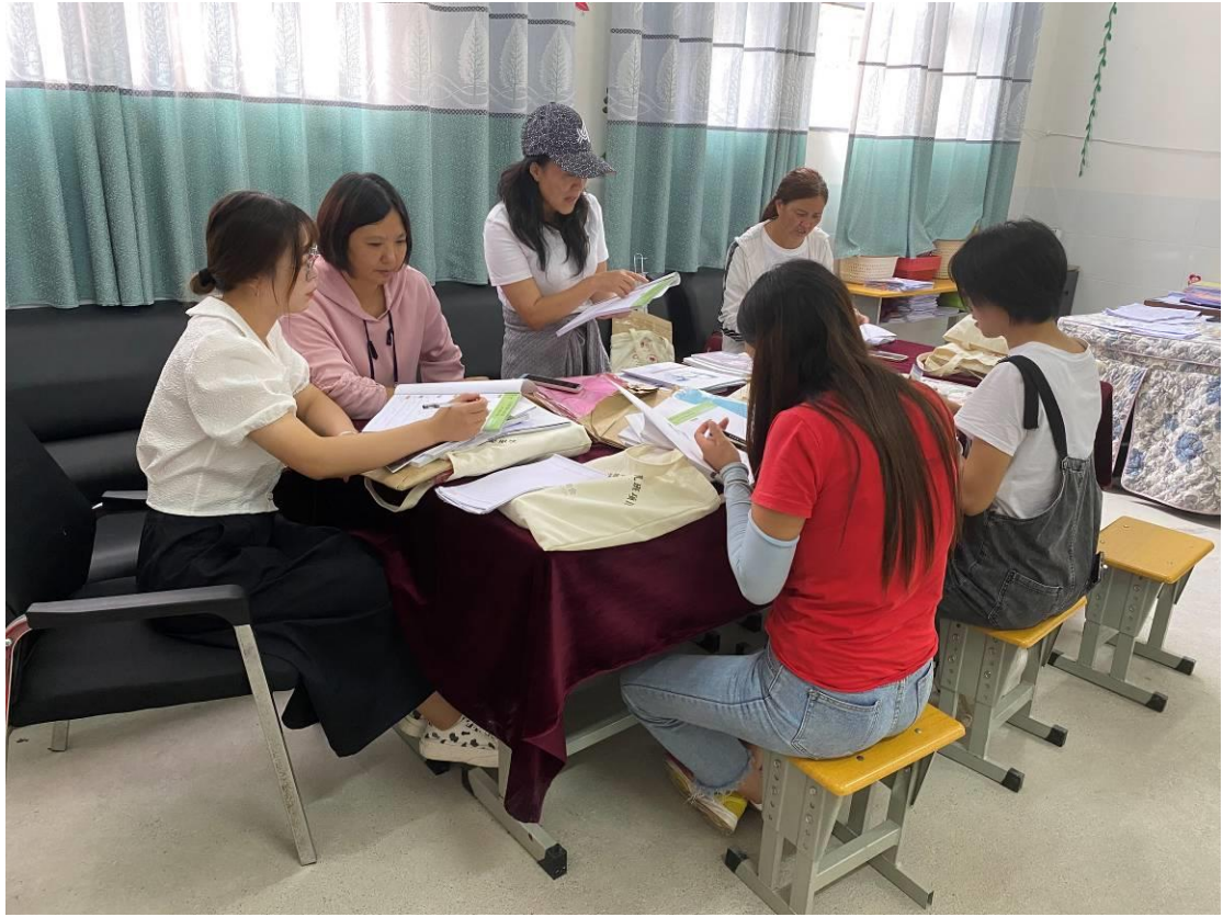
项目人员督导时检查幼儿班教师备课本的使用情况