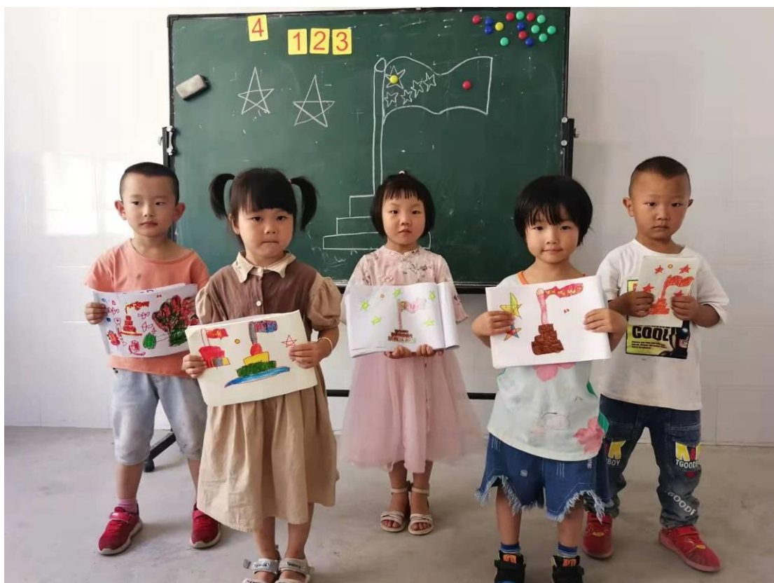
花朗中心园的小朋友展示自己画的国旗