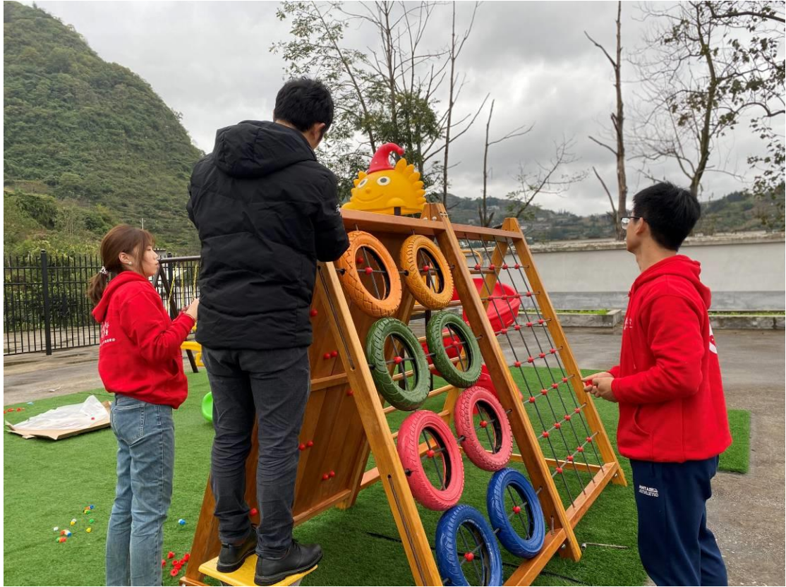
拜访人员为幼儿园安装攀爬架

爬架和室内书架的安装。幼儿班小朋友也为到访人员献上了精心准备的舞蹈节目。拜访人员还到幼儿班孩子家中进行了入户拜访，了解了孩子的家庭情况以及孩子家长对项目幼儿班的看法。