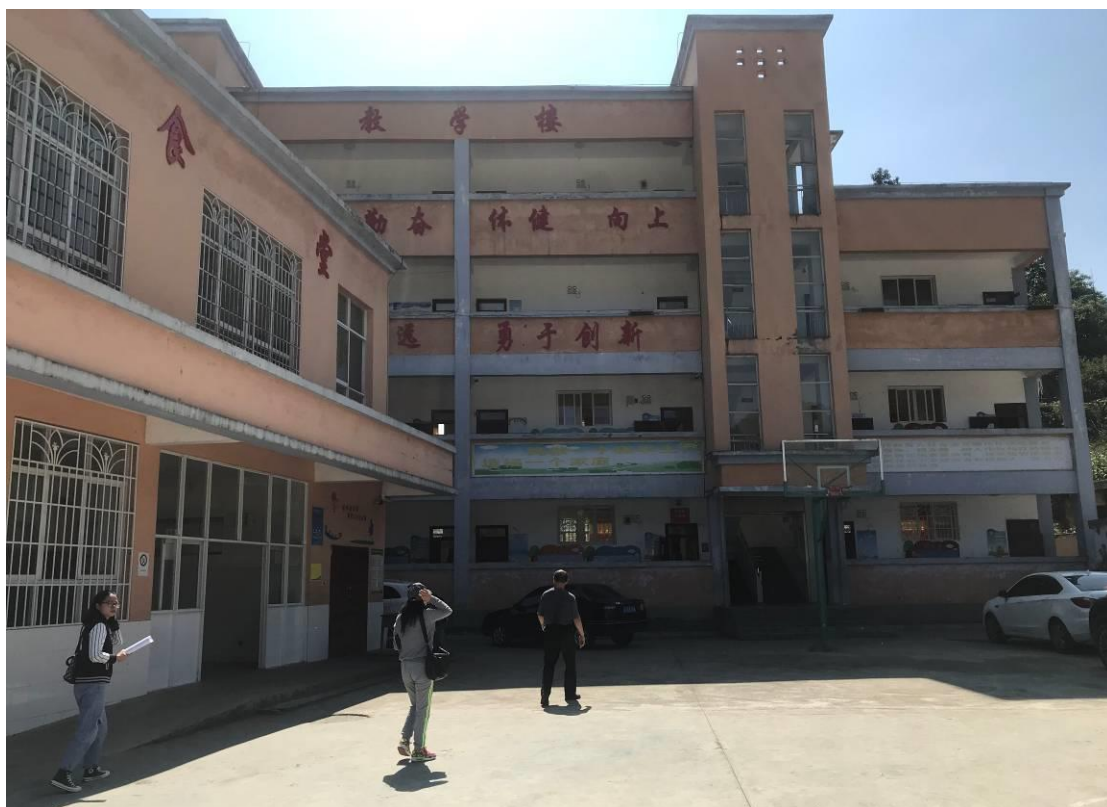
项目人员在发达坪小学了解幼儿班户外活动场地情况